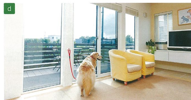
壁には愛犬をつなげるリードフックを設置。リビングの外には愛犬と一緒に屋外でつるげるウッドデッキが広がっている