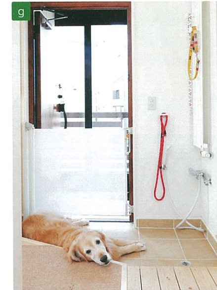
玄関+シャワースペースはタイル張り。ごろんとすれば夏はひんやり気持ちいい