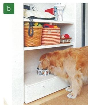
大型収納のキッチン側には、愛犬の食事スペースが組み込まれている