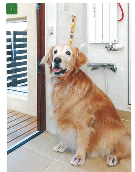
玄関にリードフックがあると便利。お散歩の準備ができるまで「ちょっと待ってね」