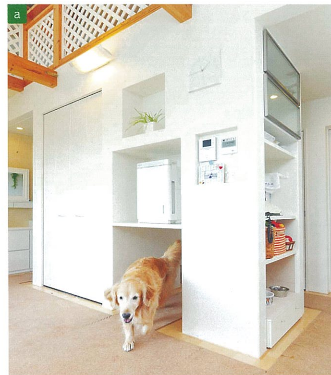
LDKにある天井までの高さの大型収納は、周囲をぐるりと回遊でき、一緒に追いかけて。中央部分のトンネルは、ケージがすっぽり入るように設計