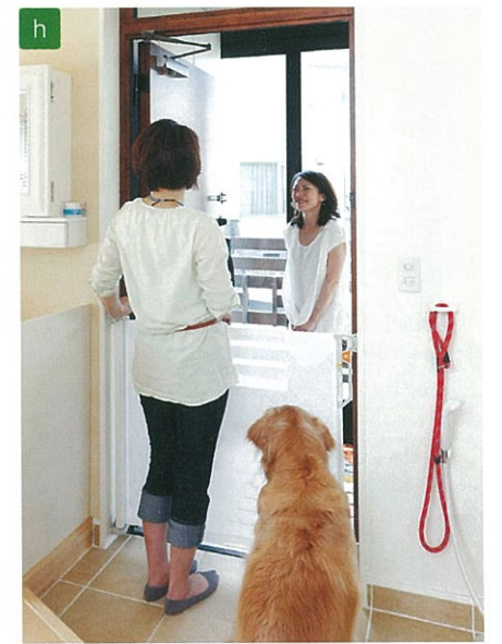
入口に愛犬の飛び出し防止のゲートがあれば、犬が苦手なお客様も飼い主さんもお互いに安心