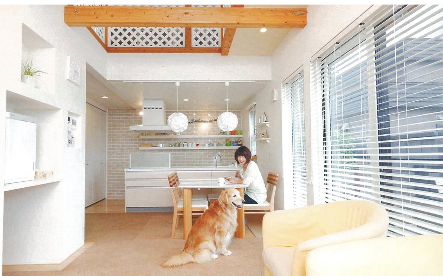
オープンになったキッチンは、家電もすべて収納。誤飲防止のため、愛犬がとどく場所にはモノを置かず、すっきり、広々暮らせるように工夫