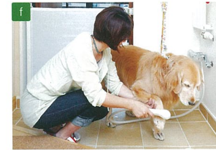
玄関入ってすぐのところに、シャワースペースを設置。部屋に入る前に汚れをさっと洗い流せる