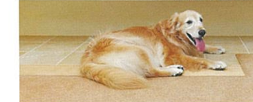
PC&TV台の下に愛犬の居場所。PCを操作する時、足元に愛犬が居られるように