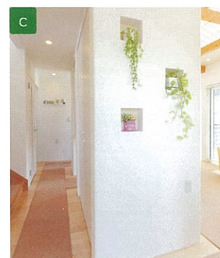
玄関に面した大型収納の側面は、愛犬がとどかない高さに飾り棚を設置