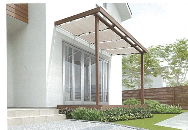
テラス: 2間6尺タイプクリエモカ・日除け グレイジュ(オプション)・ スマート雨樋(オプション)