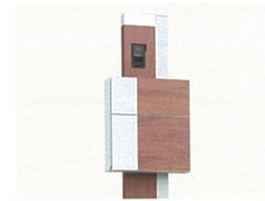
ファンクションユニット: ルミフェイス