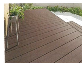
木調デッキ: 樹ら楽ステージ