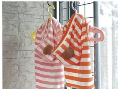
水栓設備の隣には、愛犬の洋服やリード、タオルなどをさっとかけられるウォールハンガー