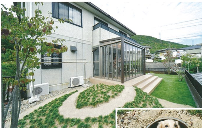
盛り土のゾーンには、穴に入るのが好きな愛犬の習性を考えてトンネルもプラス