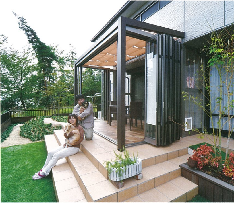
タイル張りのガーデンルームは、折戸パネルをフルオープン、フルクローズが可能。庭は、愛犬が外に飛び出さないように柵をめぐらせている。人工芝は、メンテナンスがラクで、愛犬の体も汚れない